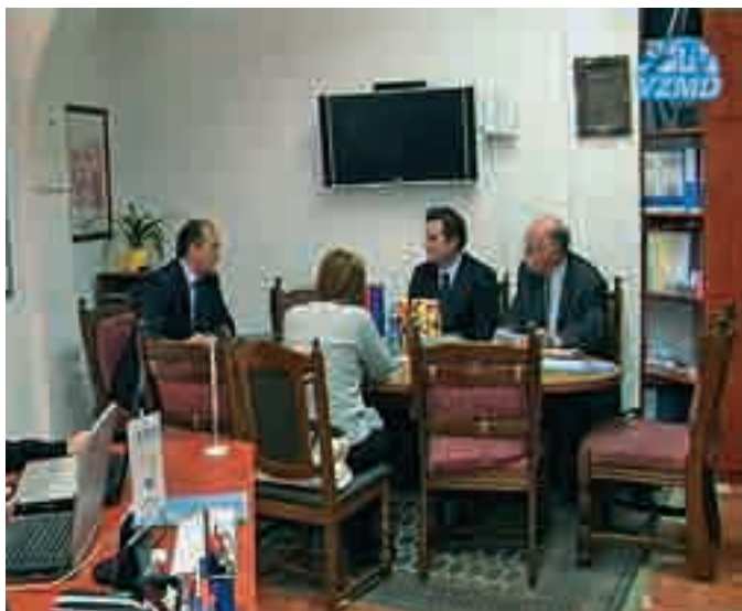
predstavnika Misije OECD sta z velikim zanimanjem prisluhnila stališčem VZMD

Stališča VZMD do samoocene so namreč precej kritična. Tako je VZMD poleg konkretnih predlogov za normalizacijo oz. izboljšanje zaskrbljujočega stanja na področju »upravljanja družb« v Republi-