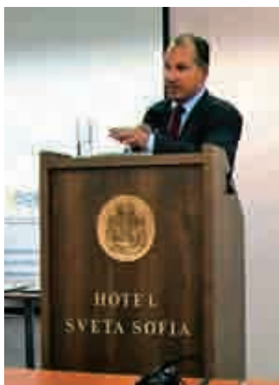
predsednik VZMD je bil na konferenci v Sofiji kot častni govorec deležen številnih vprašanj investorjev

9. junija 2009 je predsednik VZMD v okviru samostojnega programa VZMD investo.si odpotoval v Sofijo, Bolgarijo, kjer se je udeležil konference v okviru investicijskega kongresa pod okriljem Bolgarskega združenja investorjev (Investors' Association – Bulgaria) ter Analitično – kreativne skupine (Analytical Creative Group Ltd), namenjenega izboljševanju investicijskih praks in normativov z ustanavljanjem investicijskih klubov, ene od dejavnosti Svetovne federacije korporacij investorjev WFIC.