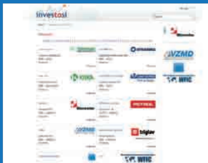
posnetek portala investo.si, samostojnega programa v okviru VZMD za podporo tujim investitorjem na kapitalskem trgu RS