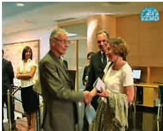
predsednik in članica Sveta VZMD pred skupščino

Na 12. skupščini Istrabenza, d.d., avgusta 2008, so bili udeleženci priče številnim, bolj ali manj pričakovanim, predlogom. Na skupščini je bilo zastopanega kar 89,7 % kapitala in kljub temu, da je še pred skupščino kazalo, da bo kar 49 % kapitala ostalo brez glasovalnih pravic, so imeli glasovalno pravico prav vsi prisotni delničarji.