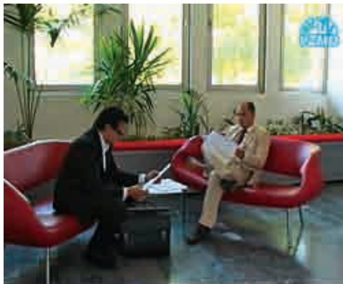
predstavnik VZMD neposredno pred skupščino Kemofarmacije

Na sedežu družbe Kemofarmacija, d.d., se je odvila 16. skupščina delničarjev, na kateri je bilo prisotnega 97,11 % kapitala oziroma 811.139 delnic/glasov z glasovalno pravico. Sprejeti so bili vsi predlagani sklepi dnevnega reda.