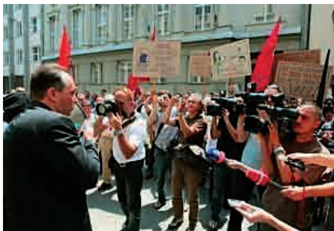
tudi na demonstracijah pred poslopjem Vlade RS je predsednik VZMD odločno in glasno izrazil solidarnost z malimi delničarji in delavci Slovenske industrije jekla (SIJ)

Predsednik VZMD je 29. maja 2008 v Državni zbor RS vložil obsežen predlog amandmajev VZMD k novelama ZGD-1B in Zpre-1. Kot je bilo tudi javno izpostavljeno, je VZMD sicer v pretežni meri pozdravil Predlog Zakona o prevzemih (Zpre-1B), vendar pa so bili dolžni opozoriti na dva, po njihovem mnenju izredno pomembna in problematična sklopa, ki kljub argumentom in vztrajanju VZMD v predlogu Zpre-1B nista bila upoštevana.