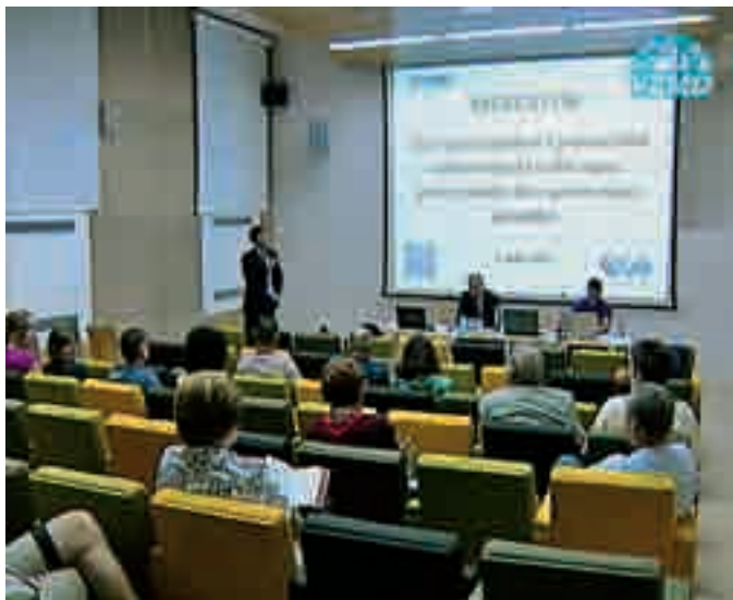
Zbor pristopnikov k odškodninski tožbi zoper prevzemnike družbe Mercator v Mestnem muzeju v Ljubljani

jev Mercatorja za možnost iztožitve škode, ki je posameznemu delničarju nastala zaradi odsotnosti prevzemne ponudbe.