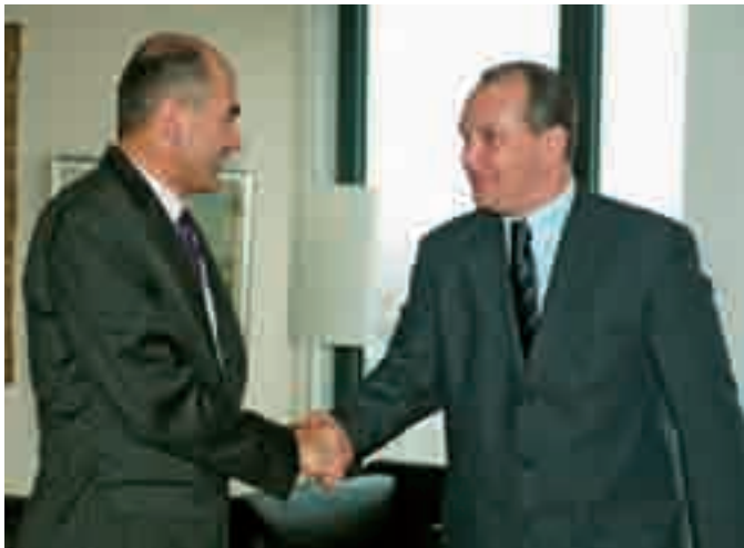
sprejem pri predsedniku Vlade Republike Slovenije Janezu Janši je potekal v luči prizadevanj za spremembe področne zakonodaje ter izboljšanje razmer za male delničarje