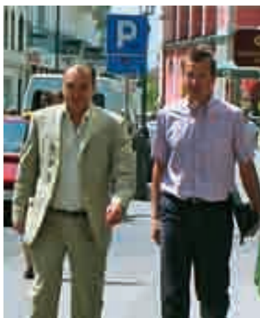
predstavnika VZMD prihajata na Oddelek za gospodarsko sodstvo Okrožnega sodišča v Ljubljani

Zato so se v VZMD odločili, da ponovno povabijo vse iztisnjene delničarje, da se pridružijo njihovim prizadevanjem za sodno določitev in pridobitev primerne denarne odpravnine oz. dodatne odškodnine v primeru izvensodne poravnave. 23. aprila je tako vseh 563 nekdanjih delničarjev SCT prejelo pismo VZMD s Pogodbo o sodelovanju in pooblastilom odvetniku. Tako je VZMD vsem omogočil, da postanejo stranke v postopku brez stroškov, ki bodo VZMD poravnani le v primeru uspeha iz dela tako doseženega dodatka k iztisnitveni odpravnini.