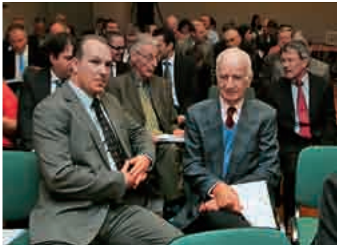
skupščine, ki se jih udeležijo tudi legendarni muzikantje (npr. Lojze Slak), so še posebej poskočne

krize se bodo še morali dogoditi, da bo vendarle prišlo do uveljavitve vsaj minimalnih standardov in kulture upravljanja družb, kakršna je samoumevna v urejenih ekonomijah.