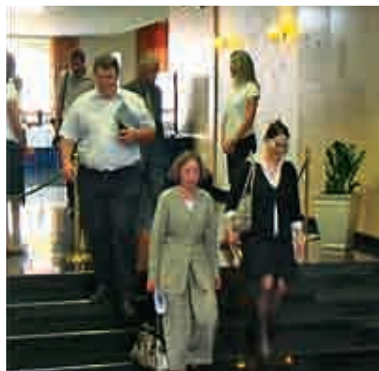
prihod strokovne ekipe VZMD na 12. skupščino Istrabenza

Le teden pred skupščino je namreč Maksima Holding, d.d., pod taktirko Igorja Bavčarja (večinski lastnik prek FB Investicij), 17 % Istrabenza prodala družbi KD Kapital, d.d., čemur je sledila odločba Urada za varstvo konkurence, da družbe Maksima Holding, Maksima Invest, NFD Holding, Finetol in Diamond, ki so podpisale dogovor o lastniškem sodelovanju, ne kršijo zakona o preprečevanju omejevanja konkurence.