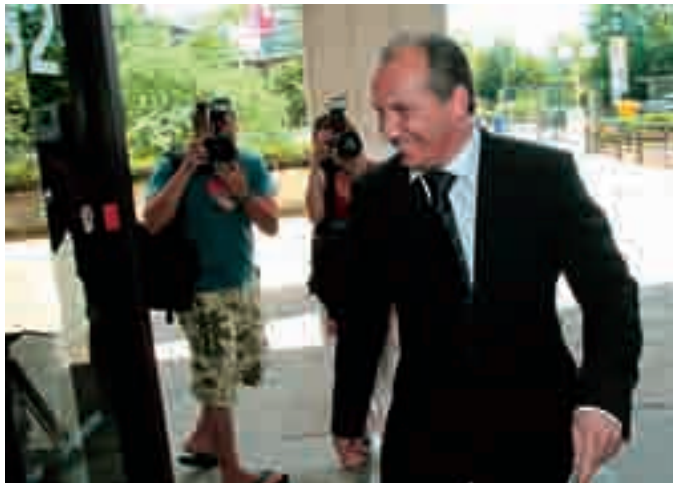
15. skupščina družbe Mercator je pomenila pomemben premik pri vzpostavitvi standardov upravljanja družb