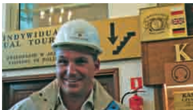
predsednik VZMD v vlogi vodje skupine predstavnikov evropskih združenj delničarjev pred spustom v znameniti rudnik soli pri Krakowu