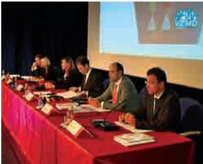
12. skupščino NKBM je zaznamovalo nespoštovanje zakonskih norm s strani pomembne državne institucije in države oz. njenih upravljalcev

tem so na Okrožno sodišče v Mariboru vložili napovedane izpodbijne tožbe na sklepe o spremembah statuta Nove KBM in imenovanje novih članov Nadzornega sveta. Okrožno sodišče je tožbeni zahtevek na veliko presenečenje VZMD v celoti zavrnilo, zato so na Višje sodišče v Mariboru v zakonitem roku vložili pritožbo. Menijo namreč, da se je prvostopenjsko sodišče zmotno omejilo zgolj na nekakšno tehnično in ozko razlago relevantnih določb Zakona o gospodarskih družbah (ZGD-1), hkrati pa se sploh ni dotaknilo ali upoštevalo zahtev Zakona o bančništvu. To kaže, da ni povsem razumelo razlogov in argumentov VZMD za izpodbijanje spornih skupščinskih sklepov.