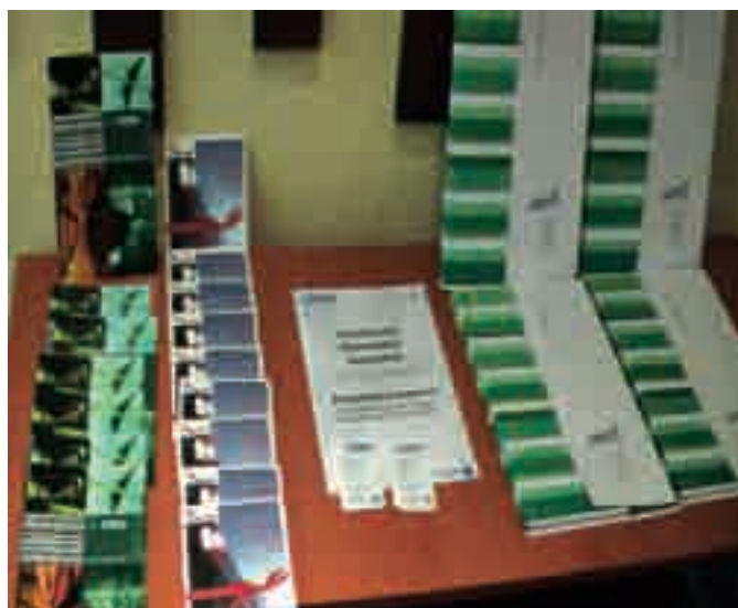
promocijski materiali slovenskih podjetij, ki sodelujejo v programu investo.si, so bili na konferenci v Sofiji v trenutku razgrabljeni