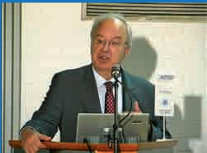
dr. Andrej Bajuk, minister za finance, med otvoritvenim nagovorom konference investo.si