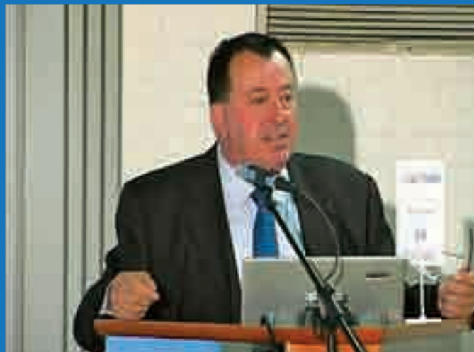
dr. Giorgio Dominese, koordinator Centralne vzhodno – evropske mreže univerz (CEEUN), je navdušil z aktualnim predavanjem o investicijskih tveganjih

Vseslovensko združenje malih delničarjev je 21. junija 2008 organiziralo prvo mednarodno konferenco investo.si o investicijskih priložnostih v Sloveniji in regiji jugovzhodne Evrope.